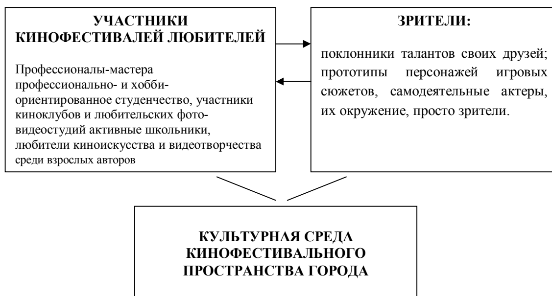
Рис. 1. Культурная среда кинофестивального пространства - участники и зрители любительских кинофестивалей

Таким образом, культурная среда большого города - это творческая и художественная интеллигенция, профессионально- и хобби-ориентированное студенчество, участники кино клубов и любительских фото- видеостудий, активные школьники, любители киноискусства и видеотворчества среди взрослых авторов, поклонники талантов своих друзей; прототипы персонажей игровых сюжетов, самодеятельные актеры, их окружение, просто зрители. Все эти посетители кинофестивалей являются потенциально развивающей силой, определяющей стратегии развития данных кинофорумов.